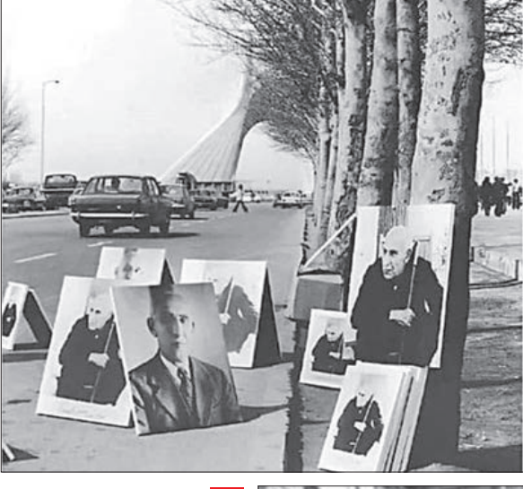
قاب نوستالژی ۲ فروش عکس‌های مصدق در کنار خیابان آزادی سال ۱۳۵۸ (عکاسباشی)