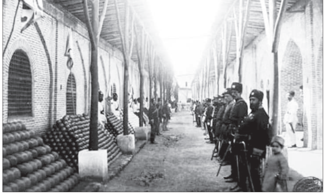
قاب تاریخ قورخانه یا کارخانه اسلحه‌سازی در دوره ناصری (هم‌اکنون ایستگاه مترو امام خمینی) (سال‌های دور)